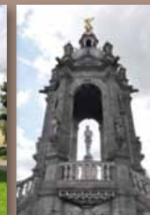
Monument Jeanne d'Arc