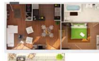
PLAN TYPE T3